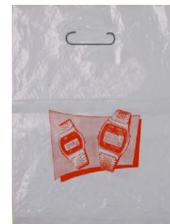
有手挽孔 或 有打孔虛線可撕開成手挽孔