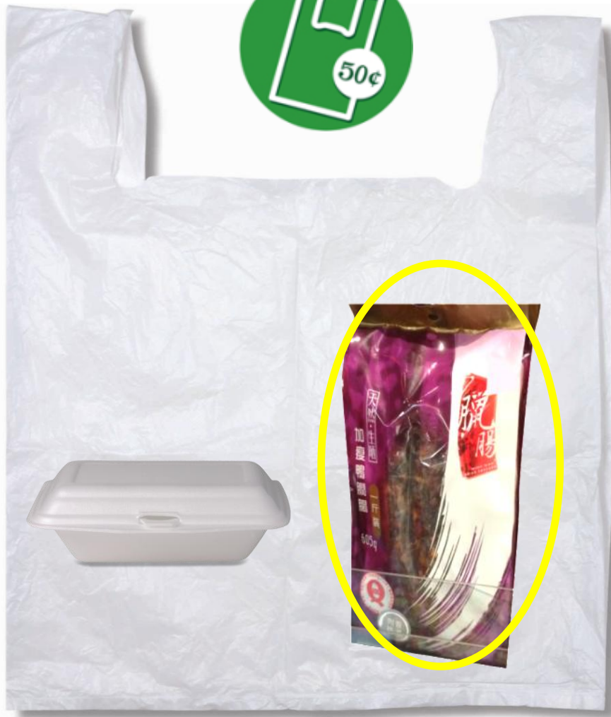
與氣密包裝的食品混合一起盛載