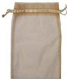
有攜帶繩索或帶條