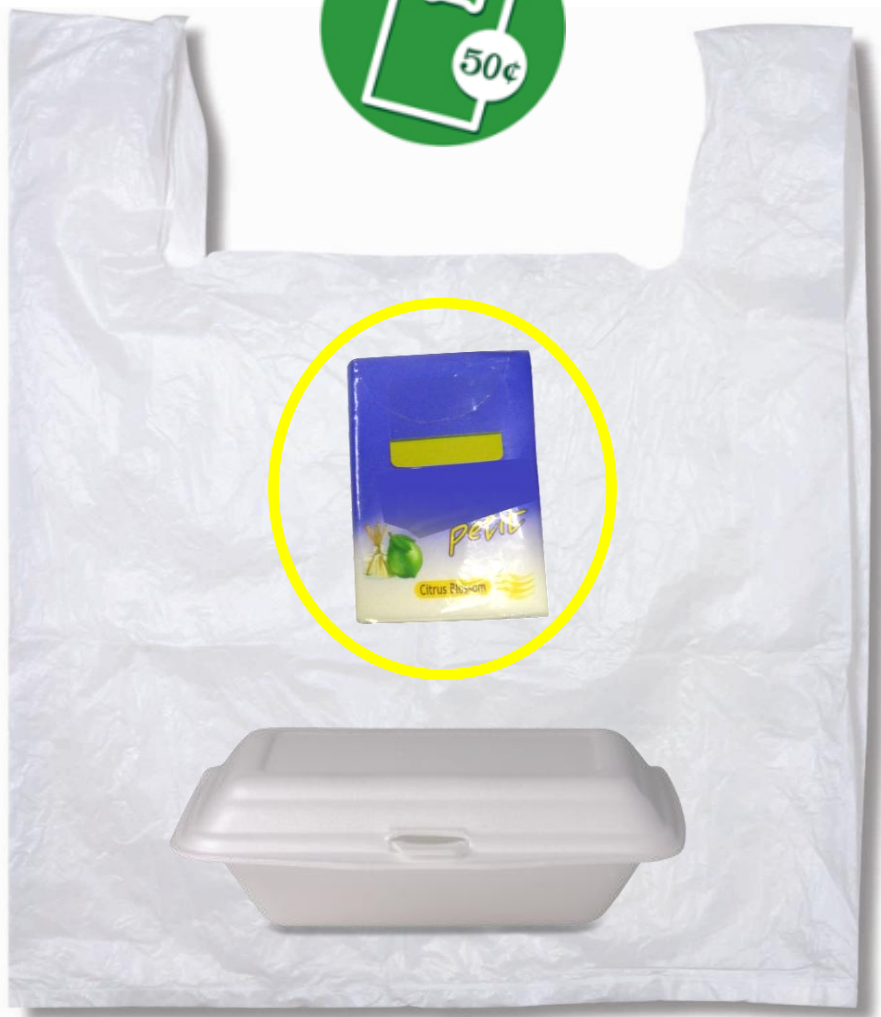
預先密封的包裝袋